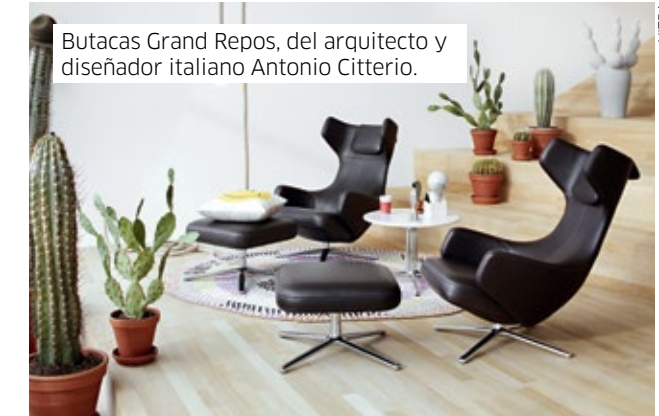
Butacas Grand Repos, del arquitecto y diseñador italiano Antonio Citterio.