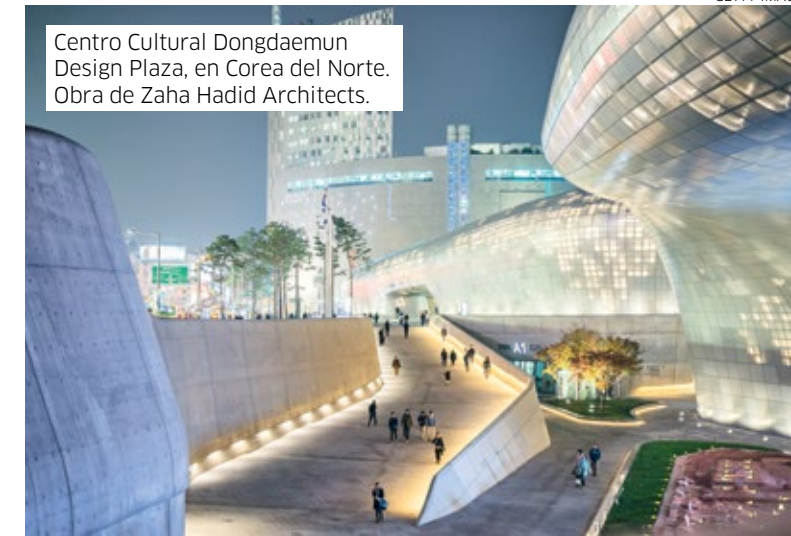
Centro Cultural Dongdaemun Design Plaza, en Corea del Norte. Obra de Zaha Hadid Architects.