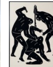
Serigrafía y escultura del artista norteamericano Cleon Peterson.