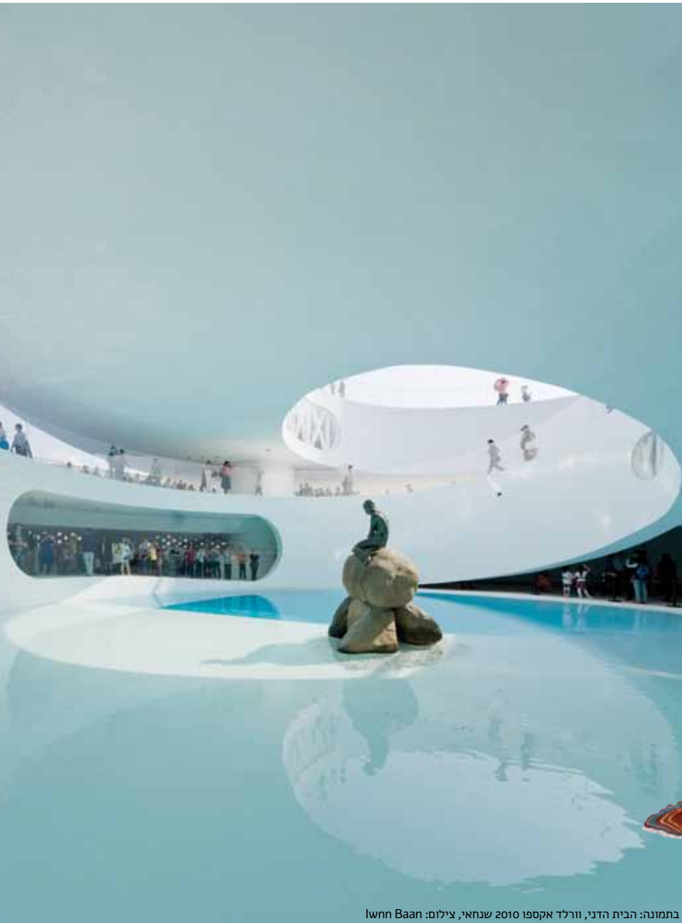
בתמונה: הבית הדני, וורלד אקספו 2010 שנחאי, צילום: Iwonn Baan